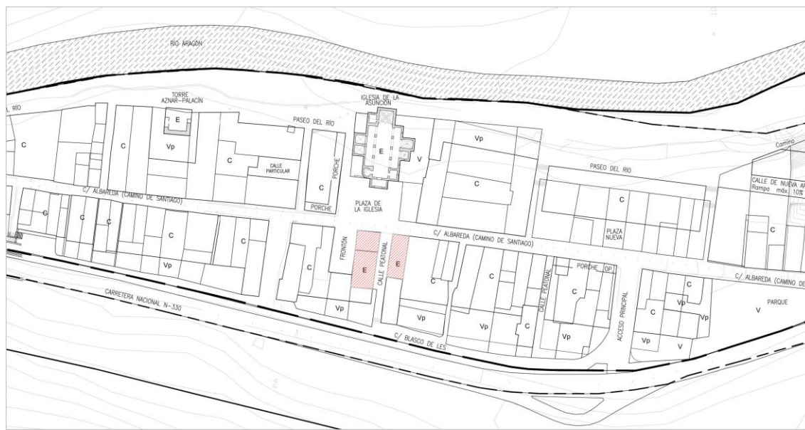
Fig.- 01 Solares afectados

Tampoco se modifican el resto de condiciones de parcela, posición, volumen o de condiciones estéticas.