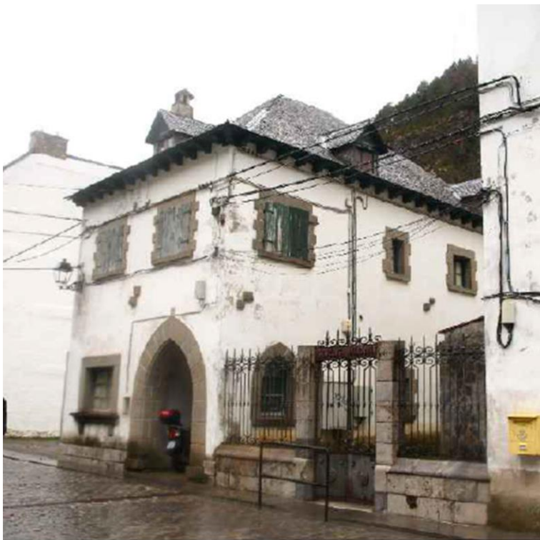
Fig .-01 Casa del Párroco